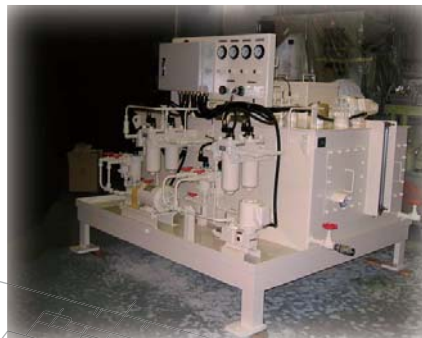
プレス用潤滑ユニット