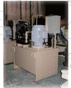
工作機テーブル昇降・テンション用