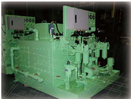
製鋼所向け潤滑ユニット