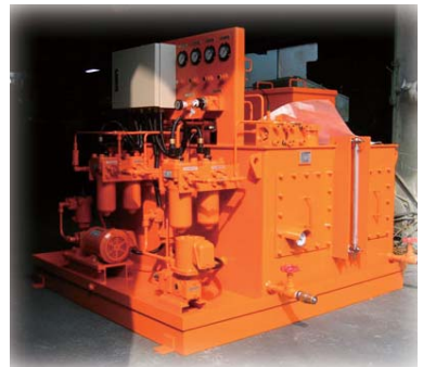
メカプレス用潤滑ユニット